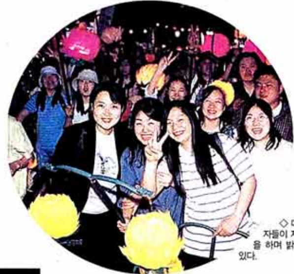
◇대학생자들이 제등행진을 하며 밝게 웃고 있다.

참가인원 작년보다 5만 늘어 15만명 20개국 대사 템플스테이 마치고 참가 십이지신, 해바라기등 장엄등 첫선