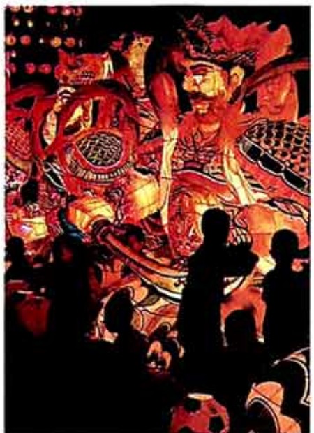
◇봉은사가전통등 양식으로 제작한 사천왕상

장엄등 갈수록 웅장·다양화 ○...십이지신, 해바라기, 별, 금강저경전... 연등축제에 등장하는 장엄등들이 해가 갈수록 웅장하고 다양화되어 연발감탄사를 자아내게 만들었다. 특히 한마음선원은 전통등 방식으로 섬세하게 만든 해바라기등 북등 종등 비파등으로 관람객들의 눈길을 사로잡았다. 천태종은 불을 뿜는 네 마리 용과 함께 12지신을 각각 본 떠 만든 12지신등, 코끼리등, 종등 장엄등을 선보였고 간간히 레이저를 쏘아 종로 밤하늘을 환하게 밝혀 탄성을 자아냈다.