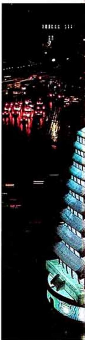
◇6일 점등된 서울시청 앞광장의 불

참가인원 작년보다 5만 늘어 15만명 20개국 대사 템플스테이 마치고 참가 십이지신, 해바라기등 장엄등 첫선