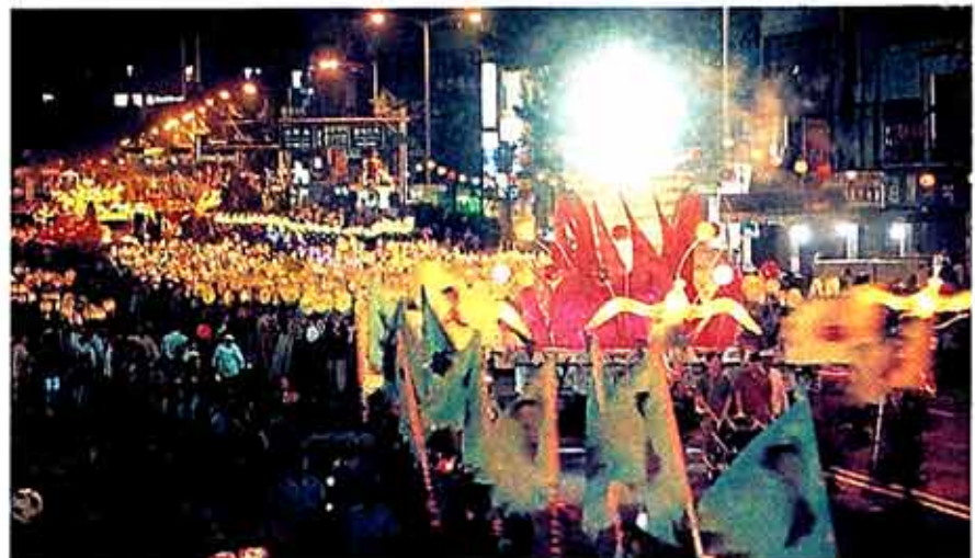
◇한마음선원이 제작한 7m높이의 장엄등 '세계는 하나-우주탑'. 올해 풍속표어인 '부처님마음으로 인류평화 성취'를 형상화 했다.