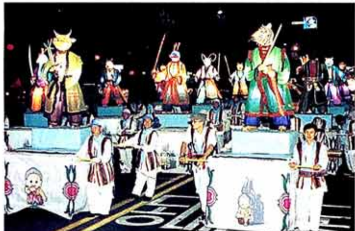
◇올해 처음 선보인 천태종의 십이지신상 장엄등.