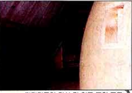
피라미드안 거실 및 황토 돔의 구조

본심·본성이 살아 숨쉬는 황토 + 소나무 참나무 장작과 구울 황토방 + 피라미드 에너지