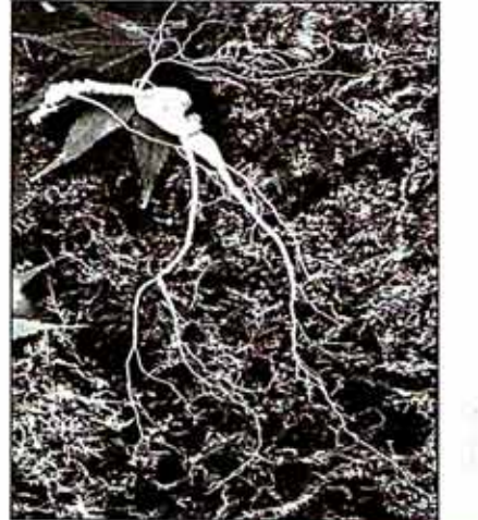
식물은 本草에는 上藥 120가지 中藥 120가지 下藥 25가지로 모두 367가지의 약용식물이 구분 기록되어 있는데 山蔘은 上藥중의 첫째가는 君藥으로 이 세상의 어떤 약용식물도 모두 아래에 불과하고 기록되어 있다.

존경하는 스님, 스승님, 부모님과 시부모님께 지친 수험생에게 평생 최고의 값진 선물 최저가격으로 불자님과 인연을 맺고자 합니다.