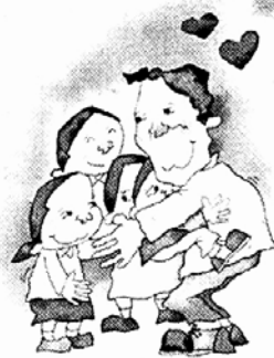
그림 · 이준석