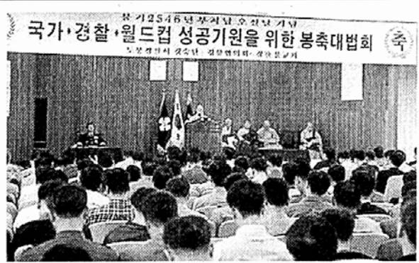
◇4월22일 열린 도봉경찰서 불교회의 '국가, 경찰, 월드컵 성공을 위한 법회'.