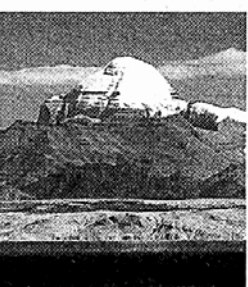
◇인도불교에서는 '키일라스'라 불리는 티베트 서남부에 위치한 '수미산' 전경.

특히 이번 순례에서는 철마년 12년마다 돌아오는 '철마년' 5~6월 각종 불교행사 열려