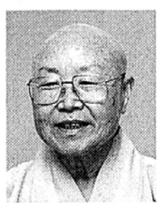
비구니 교육 및 전법도량이자 사회복지센터로서 행정기능, 인