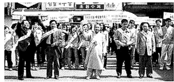
구미복지관 장애발생예방 홍보운동

대구봉축위원회(위원장 성택)는 17일 대구 금호호텔에서 불기2546년 부처님오신날 봉축위원회 결성법회를 봉행했다. 이날 법회에는 동화사 주지 성덕 스님 등 대구 불교계 지도자 80여 명이 참가해 봉축위원회를 구성하고 시정앞 점등식 등 봉축행사 일정을 확정했다.