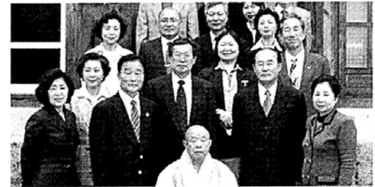
중신회소속 단체장 법전 중정 친견

직자원관리기능, 시민 문화공간 등의 목적을 수행하기 위해 광우스님은 조만간 '비구니회관 운영위원회'를 구성해 출·재가자 교육, 복지사업, 문서포교사업, 비구니 조직강화사업 등을 추진할 계획이다.