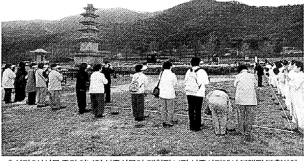
신라9산선원 중의 하나인 성주산원이 개칭된 보령 성주사에서 봉행된 봉축법회.

에 따라 이루어진 것으로, 대표단으로는 효암 총무원장을 비롯해 혜인 총무부장, 혜명 포교부장, 무의 문화사회부장, 의현 교육부장, 상계 사각부장, 일현 부산교구총장, 덕정 진각대 교무처장 등이 참가했다. 진각종 대표단은 중국을 방문하는 첫날인 4