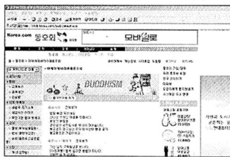
◇‘아제아제 바라아제’ 초기화면.

지난달 서울시 공모전에서 선정된 비로자나의 ‘한민족 역사문화탐사’ 프로그램은 중국 심양, 연길, 일대 고구려 문화유적지를 탐사하는 것으로 8월 11일부터 18일까지 6박7일간 실시된다. 또 월드컵을 주제로 한 지역 청소년 문화축제인 ‘S.A.Y 월드컵 페스티벌’은 5월 11일 성북구민회관에서 열린다. 02942-0636