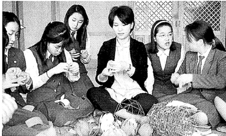
◇‘우리요? 연꽃소녀입니다.’ 서울 전선여고 연화회 학생들이 교내 심인실(법당)에서 연꽃잎을 만들고 있다.

한달 앞으로 성큼 다가온 부처님 오신날. 종립학교들은 봉축행사 준비를 어떻게 하고 있을까. 4월 1일부터 동대부고(교장 한성규)가 예쁜 연등을 만들고 있다. 이를 시작으로 전국 종립학교들이 ‘사경대회’, ‘부처님께 편지쓰기’, ‘선생님과 학부모, 학생이 함께하는 연등제작경연대회’, ‘댄스페스티벌’ 등 다채로운 봉축행사를 준비하고 있어 눈길을 끈다.