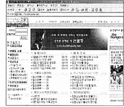
◇ ‘천불동’ 홈페이지 초기 화면.

동호회’라는 이름으로 신행활동을 해왔었다. 그러나 최근 인터넷 보급이 확산되면서 디지털 시대에 걸맞은 신행공동체를 만들기 위해 ‘천불동’으로 개명해 홈페이지(www.buddhasite.net)를 개설하고 부처님의 가르침에 의지해 ‘정정한 생활, 나누는 기쁨, 참다운 세상 구현’을 모토로 여법한 신행공동체를 향한 제2 도약을 나섰다. 천불동이 피시통신을 벗어난 인터넷에 기반을 둔 신행단체로 변모한데는 그만한 이유가 있다. 피시통신은 가입을 해야 하는 폐쇄적 공간이라 10년 이상 축적된 불교자료를 일반 네티즌들이 볼 수 없었다. 그래서 천불동은 이같은 방대한 불교자료들을 전체 네티즌들과 공유하고 아울러 회원배우운동을 알리기 위해 과감한 변신을 시도했다.