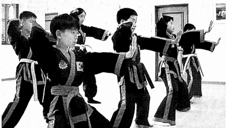
“매들어! 선무도 하고 놀자” 어린이들의 몸짓이 제법 진지하다.