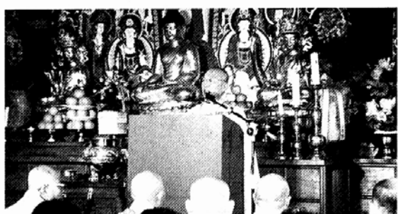
◇22일 안성 쌍미리사에서 거행된 취임식에서 법상종 총무원장 법륜스님이 취임사를 통해 포교활동 강화를 다짐하고 있다.