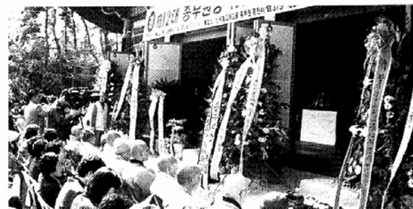
태고종 제12대 광주·전남 종무원장 법천스님 취임식이 19일 종무원사관에서 광주 운천사 대웅전에서 봉행됐다. 이날 법회에는 태고종 총무원장 운산스님을 비롯한 종단 간부 스님들과 광주·전남 종무원 산하 각사암 주지 및 신도 5백여명이 동참했다.