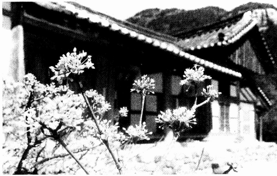
▷3월중순부터 4월초에 걸쳐 전국 산과 들은 꽃대궐을 이룬다. 사진은 노란 산수유가 어우러진 내소사경내.