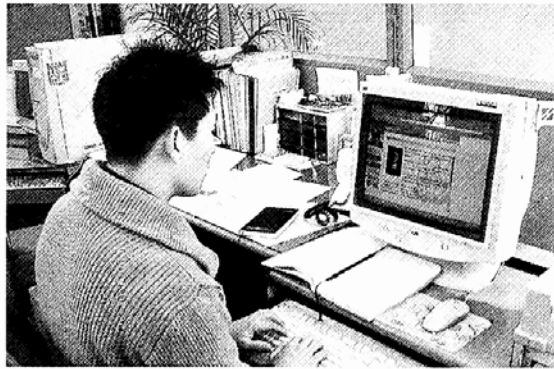
한 불자가 세무사불자회 홈페이지를 방문해 세무상담을 하고 있다.