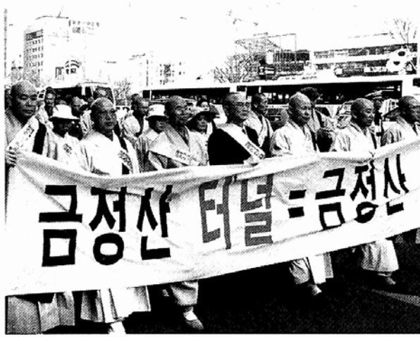
◀금정산 고속철도반대 범시민대책위가 결성식을 마친 뒤 기동행진을 벌이고 있다.

원들로부터 회비를 모아 25억원의 기금을 조성할 계획이다. 준비위가 밝힌 녹색대학 설립계획안에 따르면 생명농업학과 생태건축학과 전통기술학과 생태교육학과 대안교육학과 등 10~12개 학과에 100~150명의 학생들을 모집해 대학과정의 대안교육을 실시한다. 또 백전면 대안리 일대 10만㎡에 생태마을을 조성, 15가구를 입주시켜 유기농업교육을 실시하고 녹색대학부설 대학의학연구소와 생태농업연구소 등도 설립할 예정이다. 김재경 기자