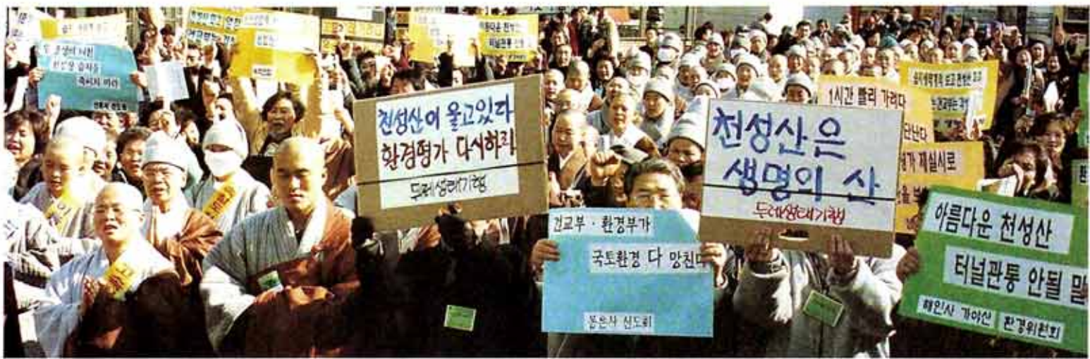
내원사 비구니스님들 국토순례 회향식

'천성산살리기'를 발원하며 1월 22일 부산의 광장을 출발한 양산 내원사 다섯 비구니스님들(왼쪽)이 25일간의 대장정 도보순례를 마치고 15일 서울역 광장에서 회향했다. '천성산살리기 국토순례 보고대회'를 가진 이날 회향식에는 조계종 총무원, 통도사, 조계사, 범어사 등에서 온 사부대중 3백여명이 참석해 사찰수행환경을 파괴하는 각종 시안에 대해 연대대처할 것을 결의했다.