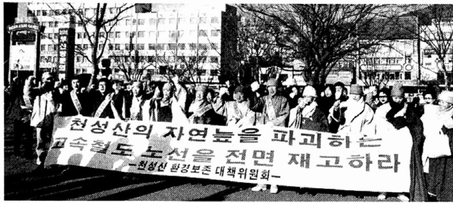
내원사 대중스님들은 22일 부산역 광장에서 국토도보순례단 발대식을 갖고, '천성산 생태계를 위협하는 고속철 건설을 중단하라'고 주장했다.