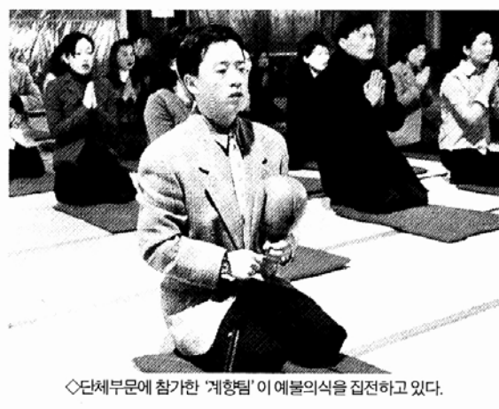
단체무로에 참가한 '계행팀'이 예불의식을 집전하고 있다.