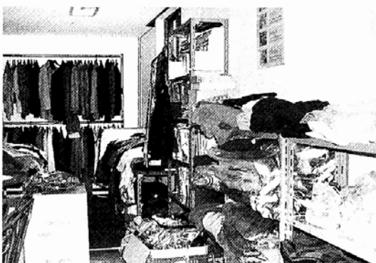
◇'내친구 초록이'에 쌓인 재활용품.

들은 물건을 너무 쉽게 버린다"며 "아직 재활용품을 '현 물건' 정도로만 생각하는 사람들이 많아 안타깝다"고 말했다.