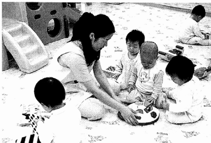
초연꽃어린이집에서 아이들이 보육교사와 함께 장난감 맞추기 놀이를 하고 있다.

여성의 야근근무와 엄마 아빠가 혼자 아이를 키우는 가정이 늘면서 24시간 어린이집이 서울 시내에만 70여 곳 운영되고 있다. 구룡사 2곳, 사립이 50여 곳이고 이중 불교계에서 운영하는 곳은 구룡사가 서울시의 위탁을 받아 운영하는 강남 선재어린이집, 서초 연꽃어린이집, 서초 장미어린이집이 있다.