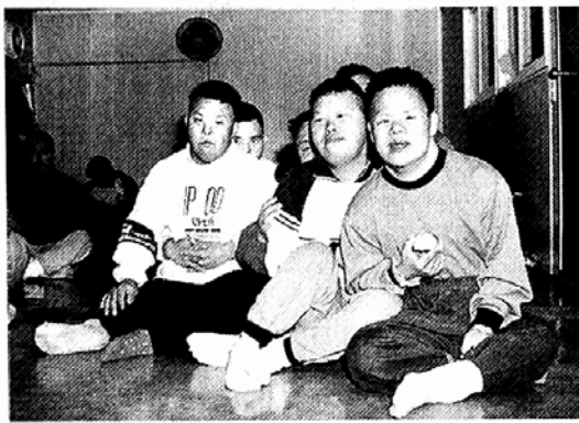
◇어려운 경제여건으로 가벼운 나들이조차 힘든 소책새마을 식구들.