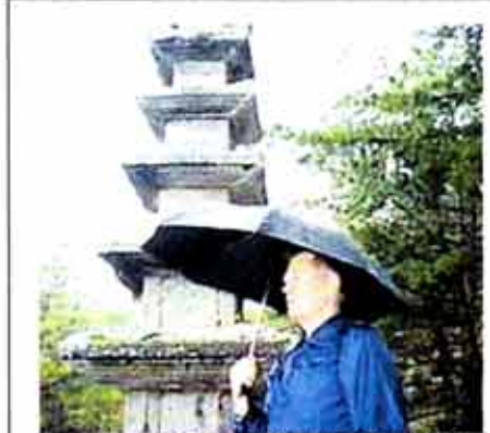
△전남 화순 운주사를 방문한 프랑스 작가 클레지오(사진 중앙인물)의 작품.

이번 특별전은 1400년대부터 1800년대까지의 옛음식책과 1900년대의 근·현대음식책을 연대별, 주제별로 분류 전시함으로써 우리나라 음식책의 역사와 흐름을 한 눈에 파악하도록 했다. 특히 이번 전시에는 궁중음식연구원에서 발굴한 <산가요록> <침주법> <가기한중일월> 등 옛 음식책 4권이 국내 최초로 일반인들에게 선보인다. <산가요록>은 술·장·죽·밥·떡·만두 수제비 등 229가지의 다양한 조리법을 담은 것으로 조선시대 초기인 1400년대의 식생활을 살펴볼 수 있는 귀중한 자료다. 1600년대 말에 한글로 작성된 <침주법>에는 약 50여 종류의 술 담그는 법에 대한 내용이 기록돼 있으며, <가기한중일월> 역시 한글로 쓰여진 책으로 조선후기의 궁중음식 조리법을 알 수 있다. 02720-3138