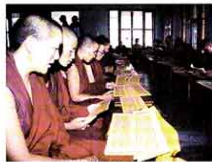
△사진은 염불 수행중인 티베트 스님들.

편안하면서도 친근한 곡들로 구성된 이 음반의 첫 장에는 모든 사람들이 괴로움과 두려움에서 벗어나 지혜롭고 자비로워지기를 바라는 경쾌한 리듬의 '옴 마니 반메 홀'과 우리나라 천수경 독송과 전혀 느낌이 다른 음악곡 '천수다라니'가, 두 번째 장에는 명상곡 '옴 마니 반메 홀'과 '삼귀의'가 수록돼 있다. 0611852-3038