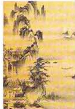
△소상팔경도 申선사의 저녁 풍경을 그린 연사모종(蓮寺模寫).

두암관에는 김씨가 기증한 179점의 유물 가운데 중국 동정호 남쪽 소강과 상강이 합류하는 곳의 빼어난 여덟 풍경을 그린 '소상팔경도'와 석가모니의 좌우에 문수·보현보살을 배치한 '석가여래삼존도'를 비롯해 '나한도', '묘법화엄경변상도',