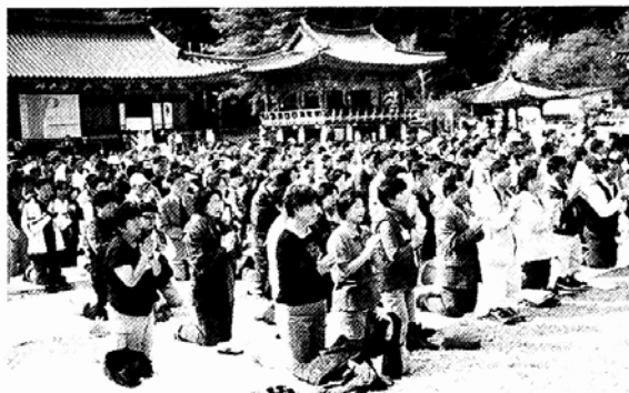
한국공무원불자연합회가 지난해 10월7일 월정사에서 개최한 창립법회 모습.

이는 공무원 조직의 특성상, 중앙부처 공무원 불자회의 구성은 각 지방행정직 공무원에 미치는 파급효과가 크다는 데 기인한 것으로 풀이된다. 지방 출장이 잦은 감사원 불자회의 경우, 도청이나 시청, 군청 등을 방문할 때 '불자회 유