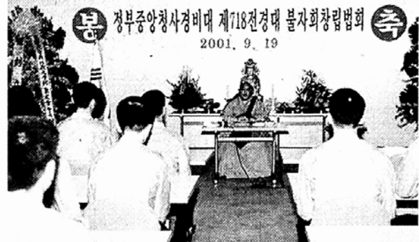
창립법회를 봉행하고 있는 718전경찰대 불교회.