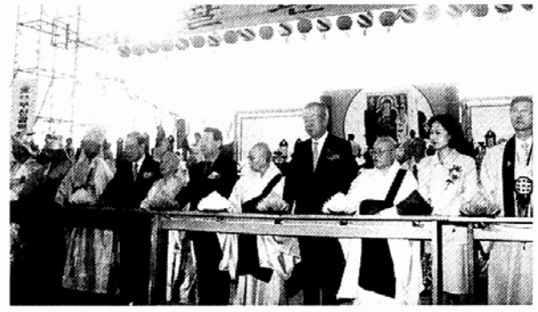
9월23일 해운대에서 3당 대표와 부산지역 유지, 시민들의 높은 관심속에 거행된 '부산아시아경기대회 성공기원 팔관회'.