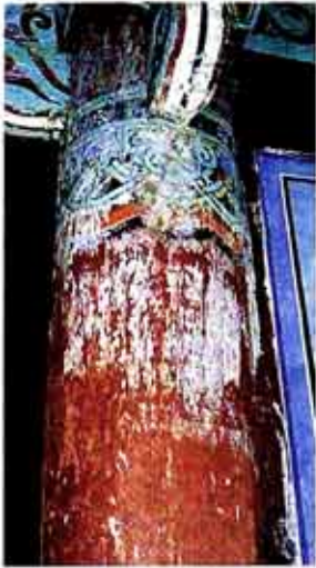
○송림사 우회루 단청의 박락된 모습.