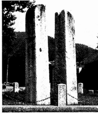
경북 고령 지산동 당간지주(보물 54호)