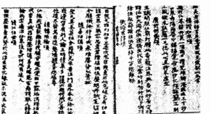
군여 스님의 행장을 기록한 <군여전(軍女傳, 1075년 현전) 정지음.

군여(均如, 923-973) 스님은 고려 초기 광종 대에 활동하였던 화엄종승(華嚴宗僧)이다. 황해도 황주에서 태어난 스님은 15세에 종형(從兄) 선군 스님을 따라 복흥사 식현 스님 밑으로 출가했으나 곧 개성 영통사로 옮겨 의운 스님에게서 수학하였다. 광종 9년(958) 왕릉사에서 실시된 승과를 주관하는 등 화엄교단의 발전에 이바지했다. 만년에는 광종이 개성 송악산 아래 창건한 귀법사의 주지로 있으면서 민중을 교화하고 불법을 널리 폈다. 이 점 때문에 스님을, 광종이 왕권을 강화하는 데 기여했던 권승으로 보는 시각도 있다. 당시는 광종이 신라 말 이래 전국적으로 발호했던 지방 호족세력을 숙청하고 과거제를 실시하는 등 왕권을 강화해 가던 시기였다. 이러한 때에 광종이 승려의 과거제인 승과를 실시하고, 자신의 원당인 귀법사 주지