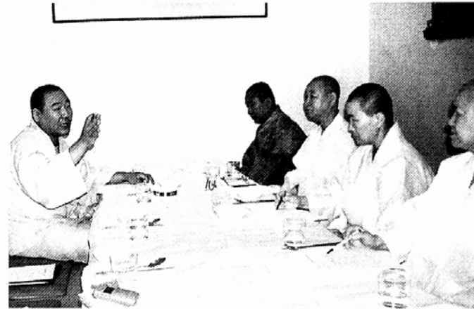
조계종과 선학원 대책위 스님들이 8월 30일 실무회의를 갖고 관계정상화안 마련을 위한 협의를 하고 있다.

서의 출발지점을 잃게 된다는 점과 석주, 진제, 정일, 범행, 성수 스님 등 원로 스님을 비롯, 500여개 사찰과 1천명이 넘는 소속 승려를 잃는다는 것은 엄청난 타격이 아닐 수 없다.