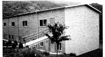
◀호두마을 위빠사나 수행처 전경.

우리나라의 대표적인 위빠사나 수행센터인 보리수선원(원장 붓다락키타스님)이 천안에 대규모 수련원인 '호두마을 위빠사나 수행처'를 마련, 내달 1일 오후 3시 개원식과 불상 점안식을 거행한다. 이름을 밝히지 않는 한 수행자의 보시로 짓게 된 수행처는 총면적 170평, 55평 규모의 수행홀 2곳을 갖췄다. 16곳의 개인숙소와 90평 규모의 수행홀이 있다. 이 곳의 위빠사나 수행은 좌선과 행선, 일상에 대