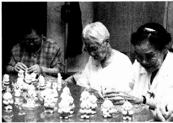
◁양초를 주물러 동자승을 만들고 있는 마포경로의원 할머니들.

교계 27개 노인복지시설 10월 연꽃마을 '작품전' 출품 준비로 바쁜나날