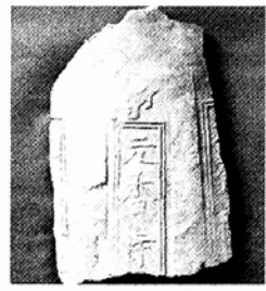
여주 원향사지서 목탑 추정지 주변에서 나온 연화사 명기와.

지난 해 1차 발굴조사에서 강원도 영월 흥녕사지호대사탑비(보물 제612호)에 기록으로만 전하던 원향사지서 목탑지가 확인돼 관심을 모으고 있다.