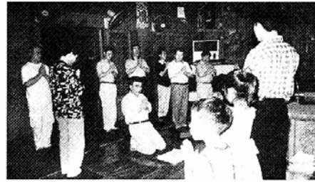
◇절에서의 예법을 배우고 있는 금용단 불자들.

이 씨는 "이제는 좀 큰 것 같아 아이들에게 불교가 어떤 것인지 직접 체험토록 하기 위해 같이 참가하게 됐다"