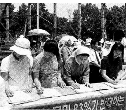
◇9일 열린 새만금 1천만 서명운동본부 발족식.