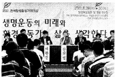
환경워크숍에 참석한 환경활동가들 모습.

전국 100여개 환경 관련 시민단체 활동가 300명이 한자리에 모였다. 6월 28-30일 경기도 양평에서 열린 전국환경활동가 워크숍에는 환경운동연합, 녹색연합 등 대표적인 환경단체부터 지리산살리기국민행동, 불교환경교육원, 수원환경운동센터 등 불자들이 참여한 단체에 이르기까지 모두 자리를 같이했다.