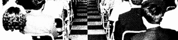
전남지방경찰청 및 산하 12개 경찰서 불교회는 16일 전남도청 회의실에서 창립법회를 봉행하고, 전남지역 포교의 뜻을 올렸다.