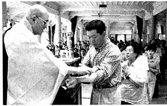
17일 수원 용주사에서 열린 제1회 경기지역불자회 합동수계법회 모습.