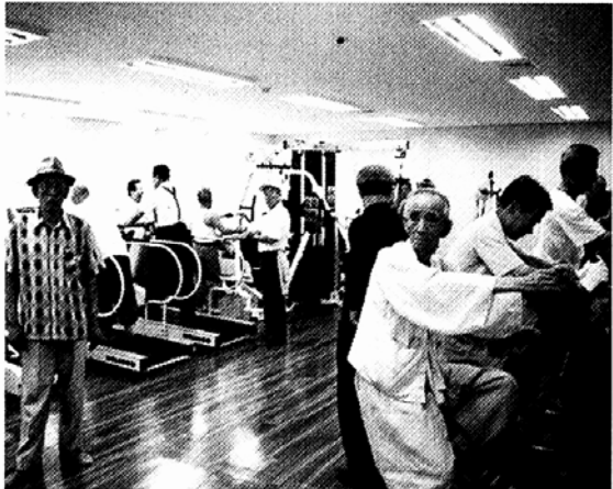
조계사가 운영하는 서울노인복지센터 체력단련실에서 헬스를 즐기며 건강 을 추스리는 어르신들.