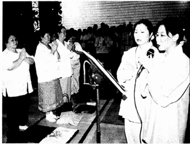
15일 조계사에서 열린 '6·15 남북공동선언 실천 다짐법회'에서 불자대표가 공동 발원문을 낭독하고 있다.