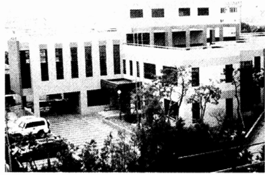
7월 초 문을 여는 영주시 장애인 복지관 전경.

각화사 태백선원 등 이름난 천년 수행도량과 청량산 도립공원 등을 보존하는 한편 영주시내의 경북불교대학, 장애인복지관 등을 통해 교육·복지봉사를 본격적으로 펼칠 것이라는 것이 정진스님의 포교방안이다.