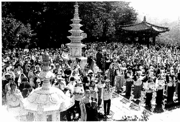
대한불교전국산악인연합회가 지난해 10월 3일 경북 안동 흥은사에서 개최한 연합대법회 모습.