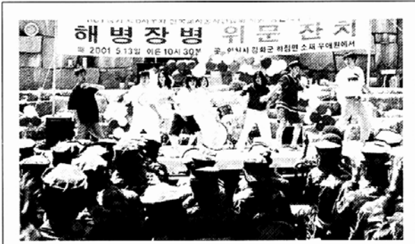
남녀 혼성으로 구성된 광문고 댄스팀의 공연을 지켜보고 있는 청룡부대장병들.

▶합창단원=조계사 청년회 보리수 합창단은 신입 단원을 모집한다. 20세부터 46세까지의 불자면 누구나 응모할 수 있다. 보리수 합창단은 남·여 혼성 4부 합창단으로 매주 수요일과 토요일 두 차례 공연한다. (02)720-5410 ▶공부방 아동=자양사회복지회관 은 햇살공부방에서 공부방 아동을 모집한다. 햇살공부방에서는 주 5일간 오후 1시부터 6시까지 미술, 컴퓨터, 글짓기, 인성발달 등의 학습지도 프로그램이 진행된다. 대상은 초등