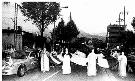
◇의정부운전자불자회는 지난 1일 108대의 회원 택시를 연등으로 꾸미고 의정부지역 제등행렬에 동참했다.