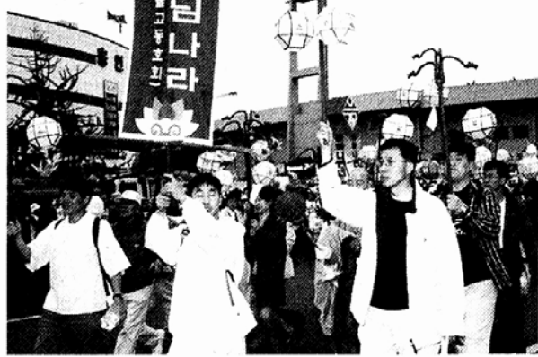
◇부처님오신날을 맞아 4월 29일 동대문운동장에서 조계사까지의 제등행렬에 처음 참가한 나우누리·유니텔 불교동호회 모습.

회원들이 참가해 옹장사, 칠보암 등을 참배하며 신심을 다질 계획이다. 부처님 나라의 봉사반은 29일 안산 동지마을과 송암동산에서 아이들과 함께 오락, 공양, 청소 등의 프로그램을 진행하며 부처님 자비를 실천한다. 또한 참선반은 매주 목요일 저녁