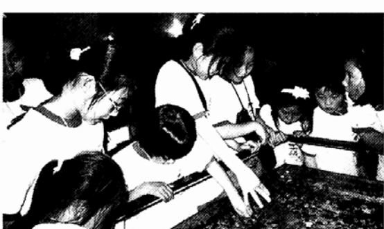
◇63빌딩 수족관을 관람하고 있는 백전초등학교 및 용소분교 어린이들 모습.