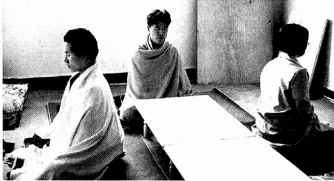
◇마야 문화원의 영어명상강좌 수강생들이 영어수업에 들어가기전 마음을 편안히 하기 위한 명상을 하고 있다.

영어조기교육 등 영어를 제대로 배우고자 하는 열기가 갈수록 확산되고 있는 가운데 명상과 불교교리도 배우고 영어도 배울 수 있는 이색 강좌가 늘고 있어 관심을 끌고 있다. 내면을 관조하는 명상을 통해 영어를 보다 쉽게 배우는 마야문화원의 영어명상 강좌와 불교교리도 배우고 영어도 배울 수 있는 영어 아함경 강좌 등이 그것이다.