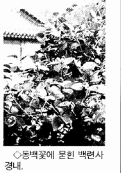
◇동백꽃에 묻힌 백려사 경내.

지역 문화의 해’를 맞아 현대불교가 연중 프로그램으로 기획한 ‘지역불교 문화기행’이 첫 걸음을 옮겨놓습니다. 3월은 흐드러지게 핀 동백꽃 숲에 묻혀 있는 남도의 산사를 찾아갑니다. 8명의 국사를 배출한 천태종 결사도량인 백려사에서는 만덕산과 강진만 바다가 빛어내는 황산의 정취를 맛볼 수 있습니다. 또 대둔사에서는 조선후기의 명필 원고 이광사가 쓴 현판이 돋보이는 대웅전과 통일사라의 숨결을 느낄 수 있는 삼층석탑(보물 제320호) 등을 만날 수 있고, 초의선사가 차분화를 일으킨 일지암도 둘러볼 수 있습니다. 남도의 봄날새가 가득한 미항사도 새봄을 맞는 불자 여러분들께 청량제가 될 것입니다.