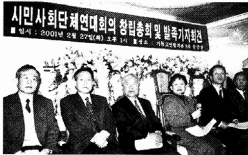
◀시민단체연대회의는 2월 27일 출범식을 갖고 정치개혁, 예산 감시 운동 등을 벌여나가기로 했다.

참여불교계가연대, 불교환경교육원, 생명나눔실천회 등 211개 단체가 참여한 단일 네트워크 출범한 시민사회단체연대회의는 참여하는 각 시민단체의 다양성과 자율성을 최대한 존중하는 열린 네트워크 정신을 담아, 시민사회의 개혁정신을 하나로 통합하는 다소 ‘느슨한’ 연대를 추구할