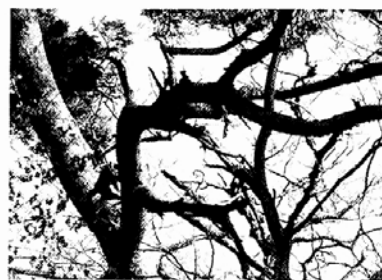
고사위기에 처한 석남사경내의 고송들

이에 석남사는 지난해부터 환경단체를 통해 여러차례 문제를 제기하고 시, 군과 연계해 소나무를 살리기 위한 대책을 마련하려고 했으나 뚜렷한 성과를 거두지 못했다. 최근 산책로 주변에 소나무 고사가 점차로 심각해지자 울산 생명의 숲 가꾸기 국민운동