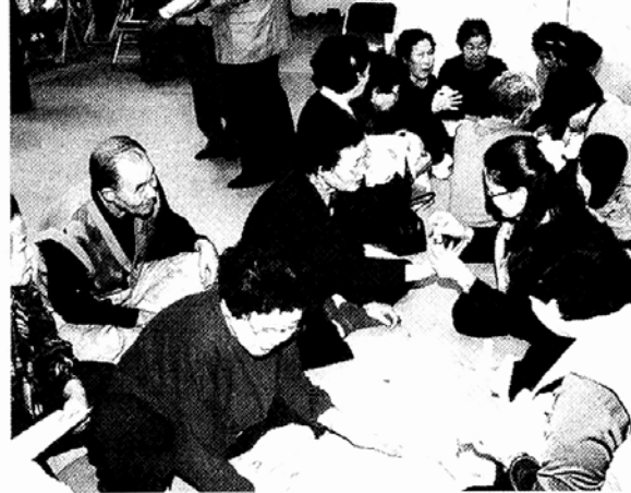
천태종 수족침봉사회 회원들이 1월19일 우면동 은초록 노인당에서 수족침 봉사를 하고 있다.