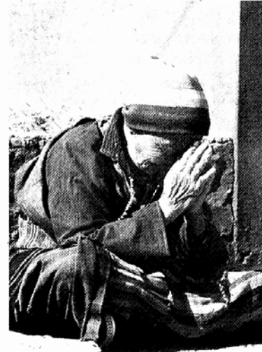
◆명상은 마음을 평온하게 하는 최고의 선물. 티베트의 한 할머니가 기도하고 있다.

글쓴이가 자주 명상법을 소개하는 이유도 그 때문이다. 우선 참다운 명상법은 '마음을 내려놓는 것'에서 시작해야 한다고 조언한다. "여러분의 마음을 인식처로 가져가십시오. 그리고 마음을 내려놓으십시오. 그리고 마음을 쉬게 하십시오." 마음을 인식처로 가져간다는 것은 참선을 통해 마음을 평온한 상태로 이끄는 것