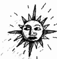
그림 · 문병성