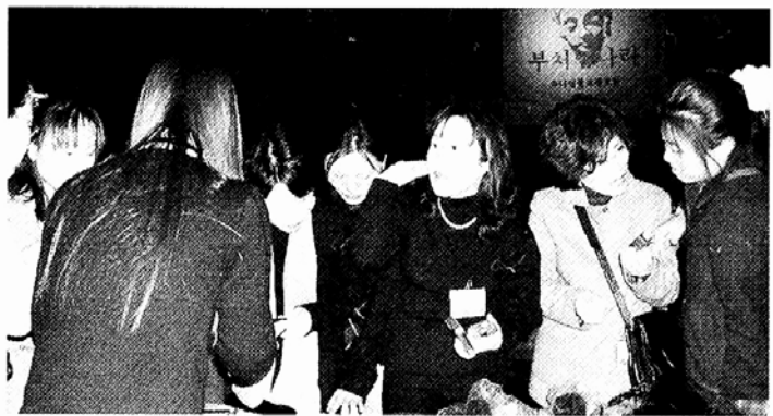
○PC통신 불교동호회들의 자비행이 풍성하다. 사진은 지난 6일 열린 유불동 바자회.