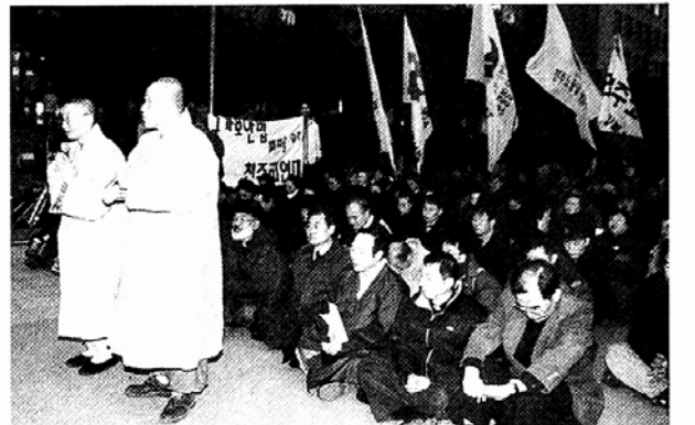
◀종교인들은 11월30일 '국가보안법 폐지 종교인 대회'를 개최하고, 6.15 남북공동선언 이행을 다짐했다.

한편 이날 집회에 참가한 단체들은 인권법 제정과 국가보안법 폐지도 강력히 촉구했다. 김재경 기자