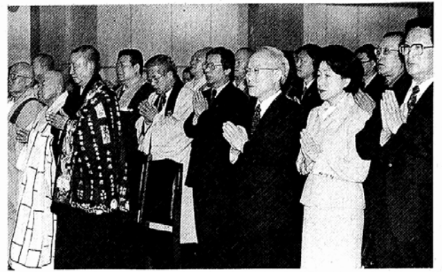
◇한나라당 불교신도회는 21일 조찬법회를 통해 조찬법회를 통해 국가발전을 기원했다.