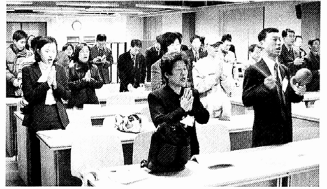
◇불자 역사보리회는 16일 상락원에서 후원의밤을 개최했다.