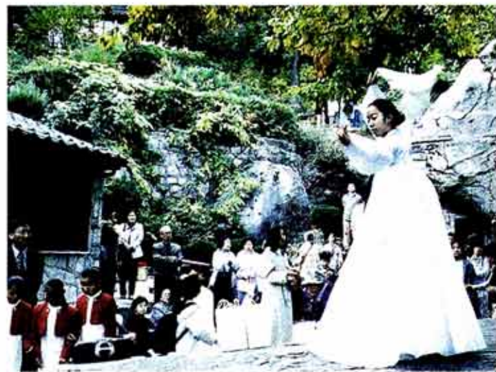
◇사찰 문화행사가 양적·질적면에서 다양한 볼거리와 즐거움을 제공하며 정착되고 있다. 지난 10월 21일 열린 북한산 심곡암 문화축제 현장.

사찰의 문화행사는 지난 10월 한달 동안만도 수차례 열렸다. 제5회 불화사 원효예술제가 10월 9일 현여명의 불자가 참석한 가운데 불화사 모전석탑 앞