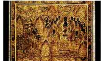
◇대영 박물관이 소장하고 있는 화엄경변상도.

특히 눈에 띄는 유물은 대영박물관이 소장하고 있는 한국유물 3200여 점 가운데 국보급에 해당하는 고려시대 화엄경변상도(華嚴經變相圖)와 청자진사당초문인(靑瓷辰砂唐草紋磁器), 조선시대 나전국화당초문경함(螺鈿菊花唐草紋景奩), 백자 달항아리 등이다. 우리 나라 국립중앙박물관에서도 주역도끼와 빛살무늬토기, 삼국시대 석조 여래좌상 등 20여 점을 이곳 대영박물관에 2년간 빌려준다. 이번 한국실 개관은 한국국제교류재단이 추진