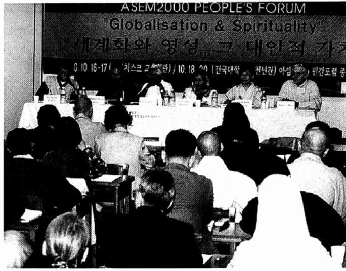
16~20일 서울에서 열린 제3회 아셈 민간포럼에서 처음 구성된 종교분과위원회는 세계화의 문제점을 종교적인 시각에서 지적, 대안을 제시했다.

국내 종교단체들이 세계화와 신자유주의에 대해 한 목소리로 반대하기는 이번이 처음이다.