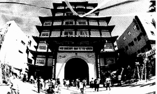
◇99년 5층 법당과 학사를 준공한뒤 1년만에 다시 7층으로 증축된 관음사.

실 강의실 음악실 컴퓨터실 등을 갖춰 마음놓고 뛰어놀며 공부할 수 있는 여건을 만들었다. 경상·경남·창원대 학생들이 자원봉사에서 히말라야까지 대장정에 나서는 계획도 세웠다. 보리수 쉼터는 교실을 수리해 만든 체육실 도서실 비디오감상실 강의실 음악실 컴퓨터실 등을 갖춰 마음놓고 뛰어놀며 공부할 수 있는 여건을 만들었다. 경상·경남·창원대 학생들이 자원봉사에서 히말라야까지 대장정에 나서는 계획도 세웠다.