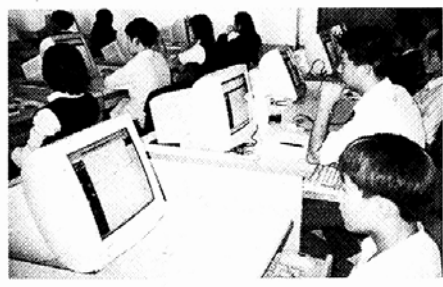
◇청담정보통신고 네트워크 디자인과 학생들이 웹디자인 개론에 대해 강의 받은 뒤 컴퓨터로 실습하고 있다.

인간이 배고픔을 가장 절실히 느낄 때는 단식이나 절식을 시작 한지 72시간 전후 즉 3일이다. 그러면 1주일에 3일씩만 다이어트를 하면 어떨까. 월~목요일은 학교나 직장에서 평소대로 먹고, 금~일요일 3일간 양을 줄이는 것이다. 다만 평소대로 먹을 때는 다음 원칙을 지켜야 한다. △첫째, 규칙적인 생활을 한다. 특히 식사시간을 잘 지키는 것. 둘째, 할 일을 빨리 끝내고 잠깐이라도 시간을 내어 칼로리를 소비하는 운동이나 활동을 한다. △셋째, 체중계를 겁내지 말고 체중을 자주 잴다.