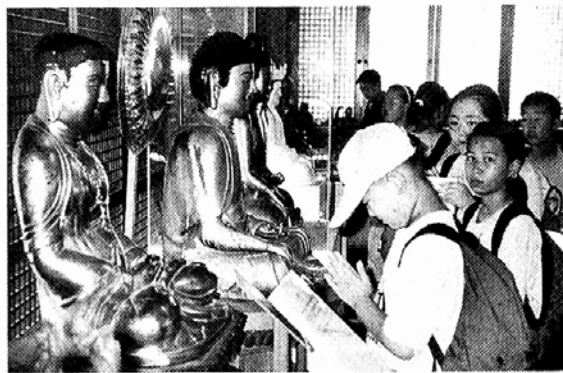
◇목야박물관을 찾은 초등학생이 목조여래좌상 앞에서 설명을 수습에 적은 뒤 합장하고 있다.

우선 불교에 관심이 많은 어린이라면 불교 목조각이 전시돼 있는 여주 목야박물관을 찾아가보자. 실내와 야외의 어디를 가나 다양한 표정을 지고 있는 목불상을 만날 수 있다. 또 목불상의 탄생 과정을 영상 강의를 통해 배울 수 있어 새싹들이 불상을 이해하는데 도움이 될 듯하다. 나들이를 겸한 박물관 답사를 원하면 김천 직지사와 순천 송광