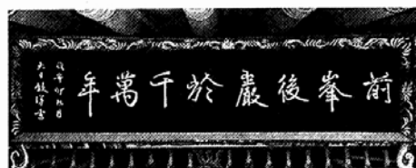
◇청룡사 비각 편액