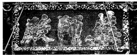
◇흥국사 약사전 편액

영조(英祖/ 1694~1776)는 조선 제21대 왕으로 속종의 넷째 아들이며 자는 광숙(光叔), 호는 양성헌(養性軒), 이름은 금(昚)이다. 영조는 1721년 왕세자에 책봉돼 1724년에 즉위했는데, 50여 년의 긴 재위 기간 동안 탕평책(蕩平策)을 통해 당쟁 방지에 힘썼다. 또 신문고 제도를 부활시켰으며, 균역법 실시와 '속대'를 편찬하는 등 조선 후기 정치, 경제, 문화 각 방면에 걸쳐 부흥의 기틀을 마련한 임금이었다.