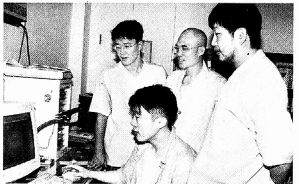
개국을 앞둔 청소년 인터넷방송국 '에피엔' 제작팀이 프로그램 송출 과정을 지켜보고 있다.

행사 위주로 운영돼 청소년 포교에는 비효율적이라는 지적도 나오고 있다. 이에 '에피엔'은 개국 후 영상 관련 전공 대학생과 청소년 지도법사 등 20여명으로 구성된 제작팀이 1주일에 1~2회 프로그램을 제작 방송할 계획이다. 또 청소년들의 호응도를 감안해 찬불가와 국악교성곡, 인도음악 등 다양한 장르의 음악 프로그램을 계속 개발해 채널 수를 늘릴 방침이다.