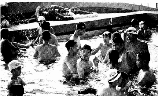
청교련소속 자원봉사 청소년들이 장애 아동들에게 수영을 가르치고 있다.

서울불교청년회는 23·24일 양일간 남양주 봉선사에서 '기초교육원 제99기 수계법회'를 봉행한다. 이번 수계법회에는 기초교육원생 이외에도 청년 불자라면 누구나 참가할 수 있으며 절아정진도 함께 열린다.