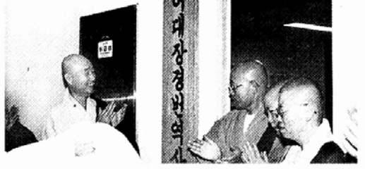
불전국역원 팔리어대장경 번역소 헌관

서울 우면산 대성사는 8월 31일 새로 건축하는 대웅전의 상량식을 봉행했다. 이날 법회에는 대성사 조실 도문 스님과 주지 환희 스님, 유종혁 신도회장, 유홍수 광복회 고문, 김상두 전북 장수군수, 한수승행 백용성조사유훈실현후원회장 대성사 신도 등 5백여명이 동참했다. 대웅전(33평)과 요사채(49평)는 내년 상반기 완공될 예정이다.