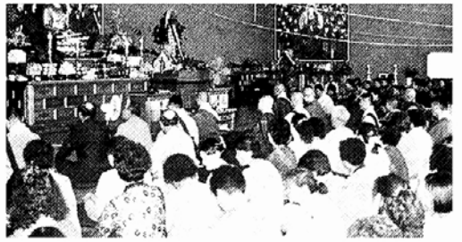
31사단 군법당 호국관음사 낙성