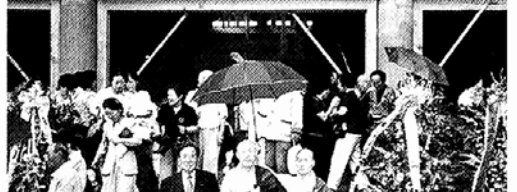
연산 대성사 대웅보전 및 요사 상량식 법회동행